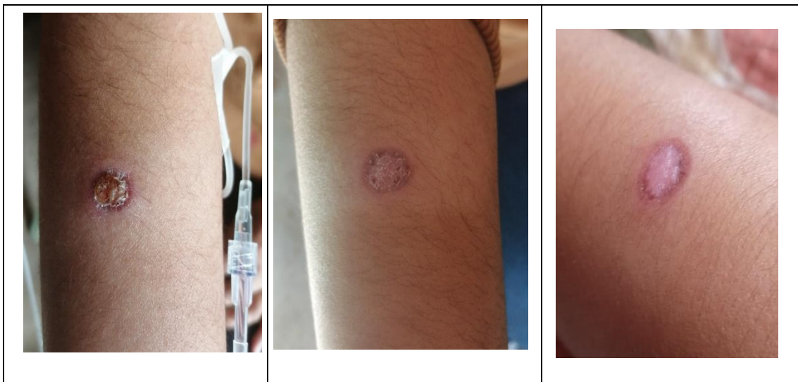
Figura 2. Fotografía del 13 y 24 de mayo y 12 de junio