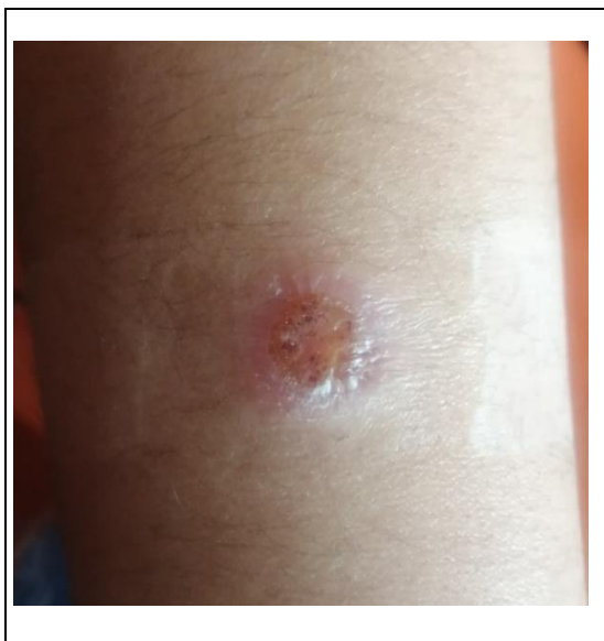
Figura 1. Fotografía realizada el 2 de mayo del 2024.

Se trata de una usuaria de 21 años de edad, estudiante de pregrado que reside en una zona rural de la provincia de Oxapampa. En el mes de diciembre, acudió a un establecimiento de salud por motivo desconocido; sin embargo, el personal que la atendió observó una lesión en su antebrazo derecho. Eso llamó la atención por las características que presentaba y le sugirió pasar a una interconsulta por el servicio de medicina para realizar el descarte de leishmaniasis (ver figura 1). En el mes de diciembre del 2023, al pasar por interconsulta en el servicio de medicina, el médico envió una solicitud para la investigación de leishmaniasis por parasitología. Así, se procedió a hacerle el frotis; no obstante, se extravió el resultado, por lo que se realizó nuevamente el mismo procedimiento en enero del 2024. El resultado fue positivo, mas no se inició el tratamiento inmediatamente, ya que no se contaba con ello. En mayo, cuando se tenía el medicamento, se le dio una referencia para realizarle exámenes en el hospital: electrocardiograma, bioquímica, hematología, inmunoserología, debido a los efectos adversos y alta toxicidad del tratamiento. Cuando el médico evaluó a la paciente con sus resultados, el día 14 de mayo se inició el tratamiento por vía endovenosa. Se le indicó meglumine antimoniate injection 1.5g / 5 ml (300 mg/ ml) por 20 días.