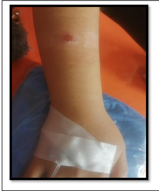
Figura 3. Vía periférica