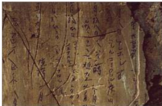
Inscripciones dejadas por antiguos trabajadores culíes en la hacienda Santiago de Punchauca.