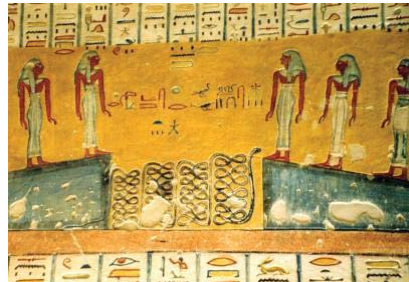
Jeroglíficos egipcios (3000 años a. C.)