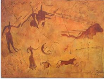
Pintura del norte de África (Argelia oriental y Túnez central, 6000 a. C.)