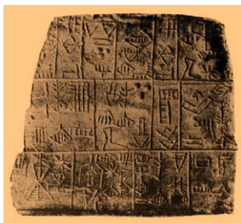
Evidencia gráfica de la cultura Sumeria (3000 a. C.)

Esta afirmación es inexacta e intentaremos demostrarlo analizando algunas evidencias iconográficas del Antiguo Perú, que también suelen ser llamados graffitis .