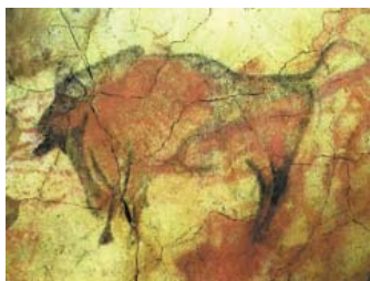
Bisonte del Paleolítico superior (15 000 a. C.) Cueva de Altamira (Santander, España).

Según estos investigadores, la idea de plasmar mensajes iconográficos sobre los muros, representa un impulso tan antiguo como los inicios de la racionalidad en el ser humano; el estudio del significado del mensaje no tiene porque limitar el estudio de la creación artística. Si consideramos que ese es el sentido, tendríamos que estudiar de manera obligatoria la iconografía de los macedonios, griegos, los antiguos egipcios y cuanta cultura haya dejado evidencia de su destreza artística utilizando diferentes técnicas (incisiones, grabados, pinturas, dibujos, etc.).