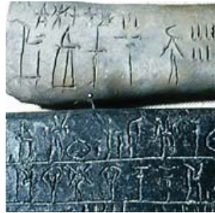
Escritura simbólica de la civilización griega (Palacio de Cnosos de Creta - 1400 a. C.)