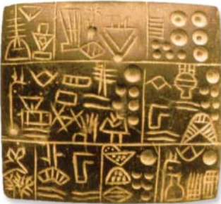
Escritura cuneiforme (último tercio IV milenio)