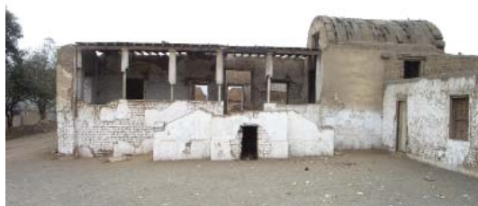
Hacienda de Punchauca, Carabayllo

Pero la historia del graffiti en el Perú puede, quizás, remontarse muchos años atrás si se toma en cuenta las evidencias urbanas y rurales existentes en la hacienda Santiago de Punchauca y en la Casona de San Marcos.