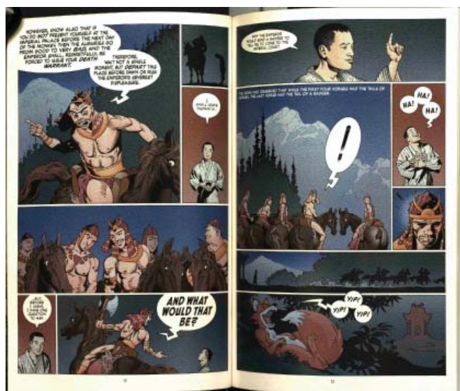
Figura 3. El engaño del mapache. Tomado de The Sandman: The Dream Hunters , por N. Gaiman & P. C. Russell, 2009, pp. 12-13. Nueva York, NY, Estados Unidos: Vertigo.

Como se ha observado, Russell tiene un rango más amplio de estilos que este, por lo que su elección por el estilo típico del cómic en este caso fue, sin duda alguna, intencional. Aun así, este volumen es vendido como “novela gráfica”, sobre todo bajo el pretexto de que es, a diferencia de los ejemplos antes mencionados, la adaptación de una novela. Quizás es precisamente por contar con esa justificación y todo el trabajo de décadas anteriores como respaldo, que Russell en este caso no intenta apartarse de los estereotipos del cómic, sino de la novela. La justificación moral de la historieta ha dejado de ser una necesidad o, en todo caso, se ha transferido a otro nivel. Ahora no se trata de revalorizar el sistema estructural del código, sino también las características clásicas de su estilo. Aunque adopte el título de novela gráfica, este volumen acepta su condición de cómic.