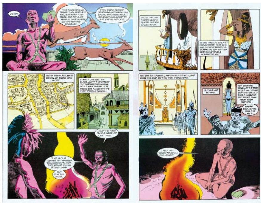
Figura 1. La ciudad de vidrio. Tomado de “The Doll’s House, Prologue: Tales in the Sand,” por N. Gaiman & M. Dringberg, 1989, The Sandman (8), pp. 5-6.

Aun así, esta literarización del cómic no es más que una ilusión. Obsérvese a nivel visual la composición de las páginas 5 a 21, de las cuales proviene el siguiente ejemplo: