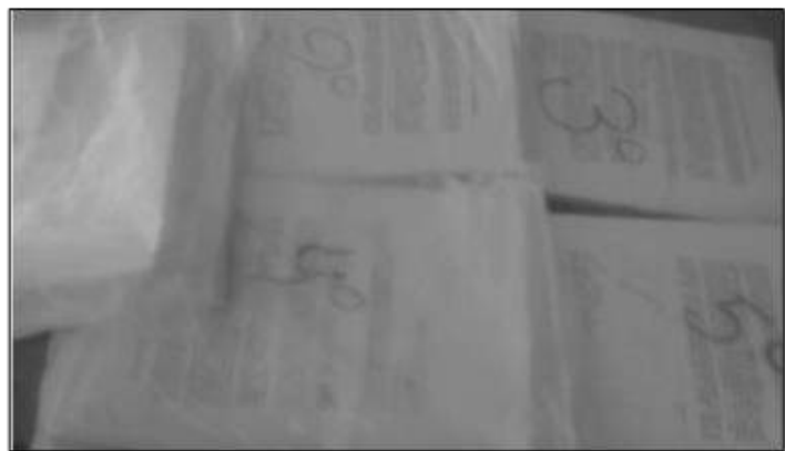
Fotografía de los consentimientos informados firmados por los padres y los cuestionarios desarrollados por los estudiantes de 1° a 5° de secundaria