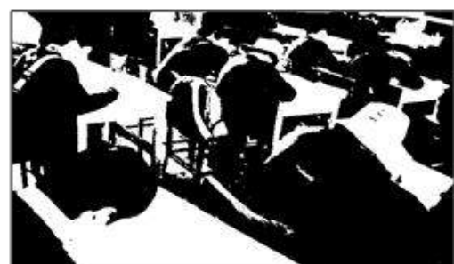
Fotografía de la evaluación realizada a los estudiantes de 1° a 5° de secundaria