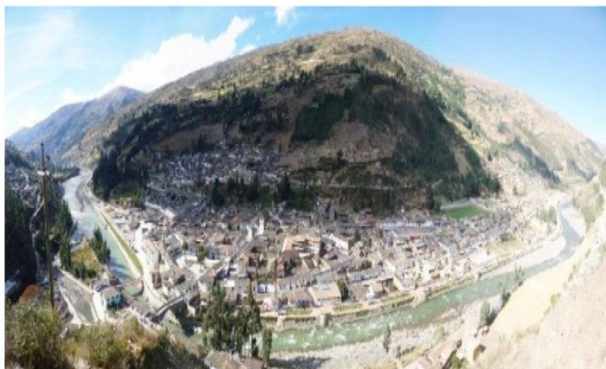
Tabla N° 2: Río Mapacho en la provincia de Paucartambo