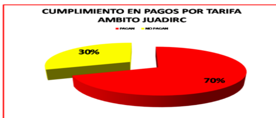
Gráfico N° 2: Cumplimiento de Pago de organizaciones de usuarios de agua. 2015 (En %)

Los usuarios no tienen claro el procedimiento de cálculo de la tarifa, ni el monto recaudado o programado debido a que no existe información al respecto. Sin embargo, perciben que existen problemas de morosidad por lo cual sugieren que el tomero (el que distribuye el agua en el campo) lleve un control eficiente de los recibos de pago de cada usuario. Es claro que para llevar este control se necesita contar con una base de datos en donde consten los pagos a fin de tener la información en cualquier momento.