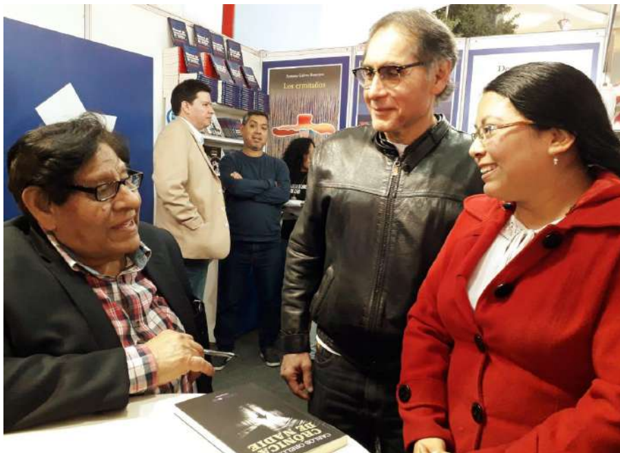
Fotografía 1. Encuentro con Antonio Gálvez Ronceros en la FIL 2019.